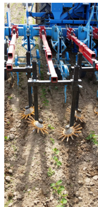
Binage du soja

Les modalités d'instruction des dossiers seront fixées et mises en œuvre au niveau régional. La FNAB et son réseau ont fait des propositions pour favoriser la prise en compte des spécificités bio lors de l'instruction des dossiers, notamment via la participation de la profession bio dans les comités régionaux de suivi du PCAE.