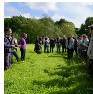
Visite de ferme

► La synthèse complète de l'étude est disponible sur demande auprès du CGA de Lorraine .