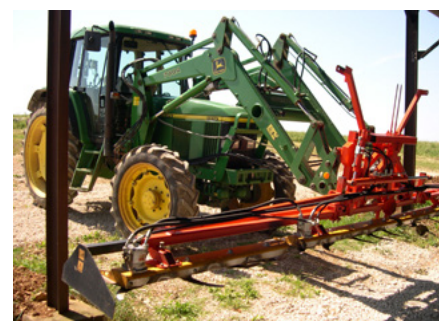
Écimeuse