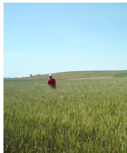
Essai de lutte contre la folle avoine

Article rédigé par Olivier BOUILLOUX, Hélène LEVIEIL et Sarah OBELLIANNE (SEDARB).