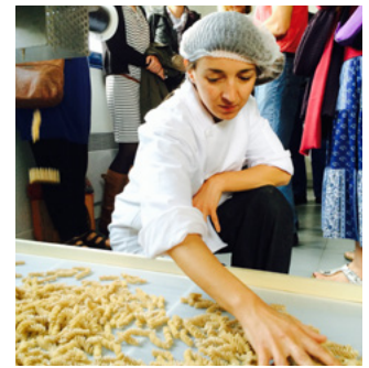
Atelier pâtes

Chaque agriculteur sème entre 1 et 6 ha de céréales, le rendement moyen étant en 2014 de 13 qx/ha. Le blé poulard est acheté 600 €/t aux producteurs par la SCIC. Avec une tonne de blé, 750 kg de farines et 675 kg de pâtes sont produits. Sorti de l'atelier, le kilo de pâtes Poulard coûte 4,5 € HT, il est revendu à 6 € TTC par les producteurs. La commercialisation s'effectue essentiellement en vente directe (marchés de plein-vent, vente à la ferme, AMAP, Biocoop). Des pâtes au petit épeautre sont produites en complément de gamme.