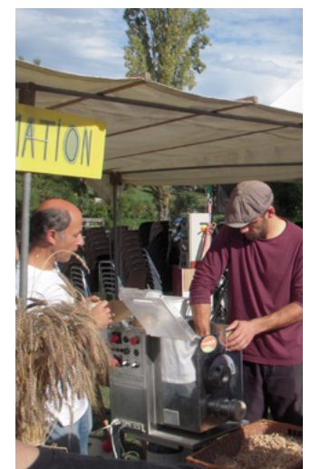
Atelier pâtes

Des essais expérimentaux menés en collaboration avec le CREAB (centre régional de recherche et d'expérimentation en agriculture biologique) ont permis de déterminer les itinéraires techniques les plus pertinents.