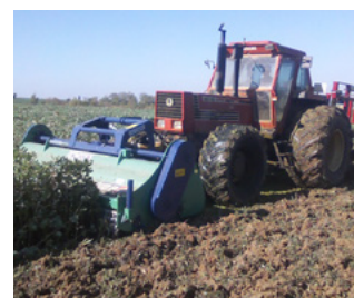
Destruction de couverts végétaux