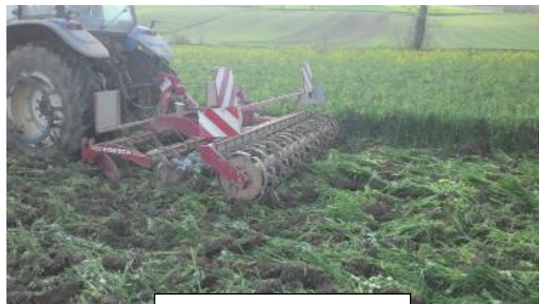
Déchaumeur à disques