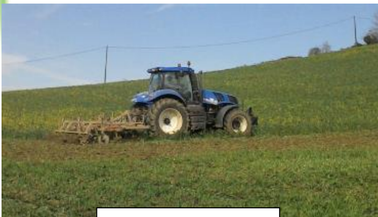
Déchaumeur à ailettes

* Essai en bas de la parcelle sur une petite surface avec un déchaumeur à disques Horsch (3.5 m, écartement entre disques de 25 cm) à la place du déchaumeur à ailettes. Plutôt satisfait mais pas assez de puissance (135 cv alors qu'il aurait fallu 160 cv) pour avoir un meilleur travail avec un effet mulch plus marqué. La structure est jolie, pas d'effet semelle comme on aurait pu s'attendre avec un outil à disques.