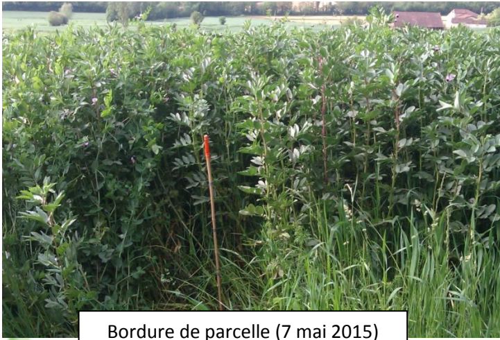
Bordure de parcelle (7 mai 2015)