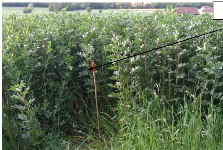
Bordure de parcelle (7 mai 2015)

Présence de limaces dans le couvert au moment de la restitution