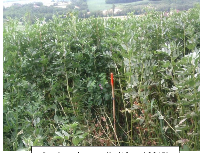
Bordure de parcelle (13 mai 2015)