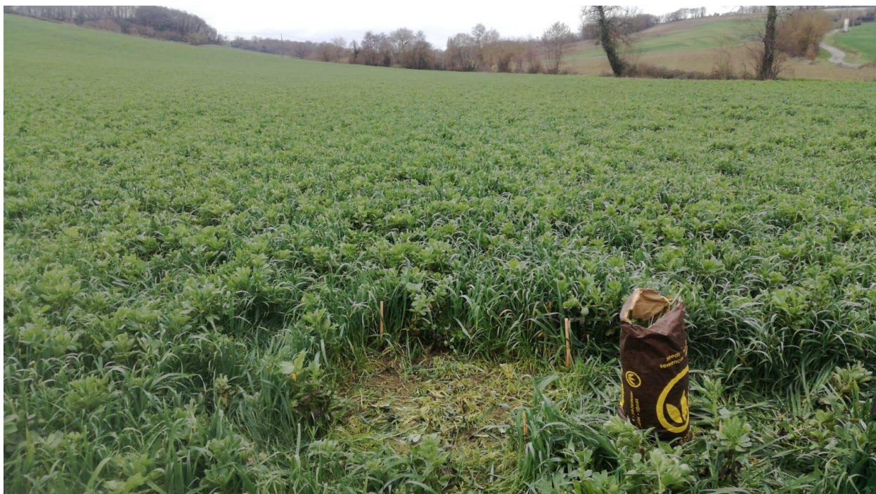
Couvert végétal au moment de la restitution le 7 mars 2019