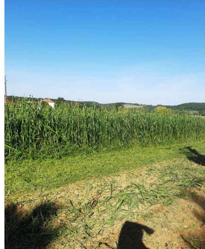
Sorgho fourrager a une meilleur vigueur de départ et a toujours une longueur d'avance par rapport aux adventices