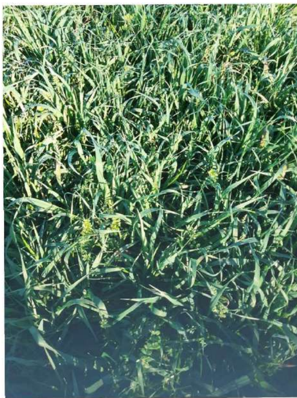
1/3 couvert hiver