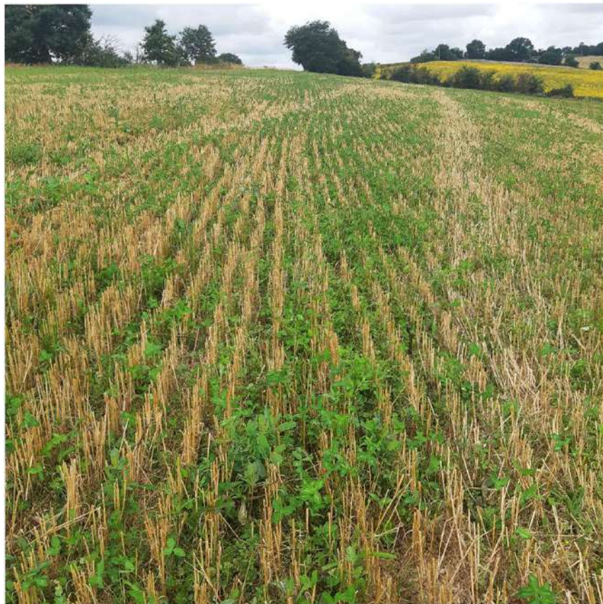
Quelques jours après récolte