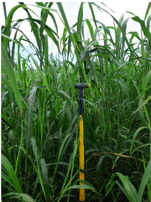
1/3 Couvert été