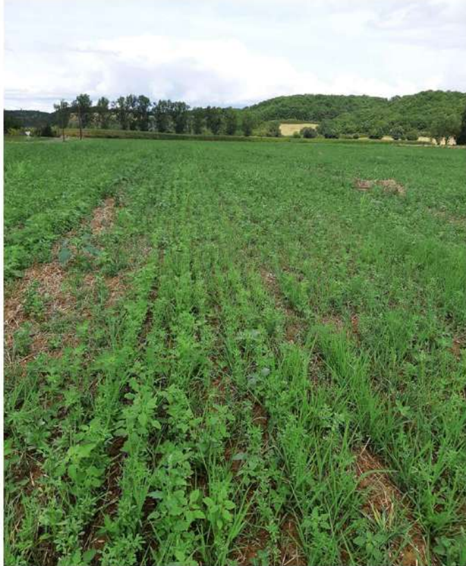
Trèfle Alexandrie pas assez poussant qui n'a pas su prendre le dessus avec les adventices estivales → broyage